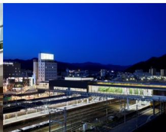
JR 山陽線 新山口駅