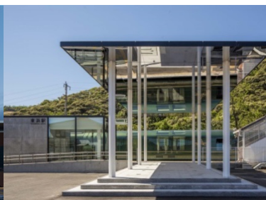
JR 山陰線 東浜駅