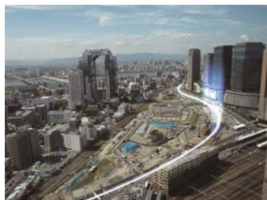
東海道線支線地下化