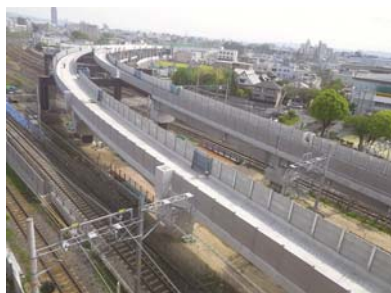
おおさか東線 東海道線乗越し部

ジェイアール西日本コンサルタンツは、JR 西日本グループの鉄道総合コンサルタントです。その業務の一環として鉄道を核とした計画・設計業務を実施しております。この度、当社の土木設計部門の業務を経験して頂き、建設コンサルタント業務への幅広いご理解、社会資本の整備と長寿命化への取り組みへの理解を深めて頂くべく、1day インターンシップ制度を設けることとしましたので、以下の通りご案内させていただきます。