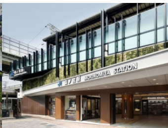
JR 大阪環状線 森ノ宮駅改良