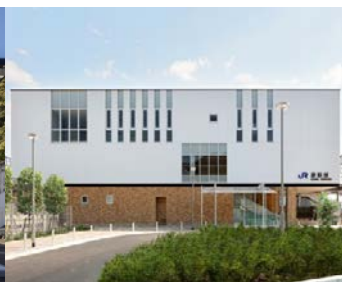
JR 神戸線 摩耶駅