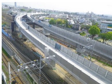
おおさか東線 東海道線乗越し部

ジェイアール西日本コンサルタンツは、JR 西日本グループの鉄道総合コンサルタントです。その業務の一環として鉄道を核とした計画・設計業務を実施しております。この度、当社の土木設計部門の業務を経験して頂き、建設コンサルタント業務への幅広いご理解、社会資本の整備と長寿命化への取り組みへの理解を深めて頂くべく、1day 仕事体験（オンライン）を行うこととしましたので、以下の通りご案内させていただきます。