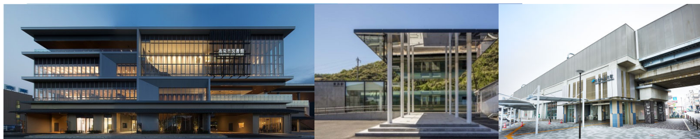
高梁駅前複合施設(高梁市図書館)